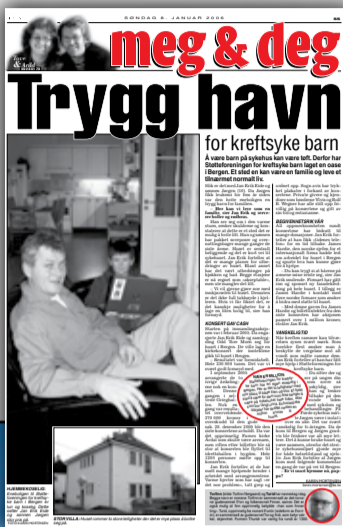
BA 8. januar i år.

I dag har Konstase og Connie navnedag. Konstase er et latinsk navn som betyr fasthet, karakterstyrke, mens Connie er en engelsk kjæleform av Konstase. Det er 229 kvinner som har Konstase som første fornavn. Det er 120 kvinner som har Konstase som eneste fornavn. Det er 842 kvinner som har Connie som første fornavn. Det er 512 kvinner som har Connie som eneste fornavn.